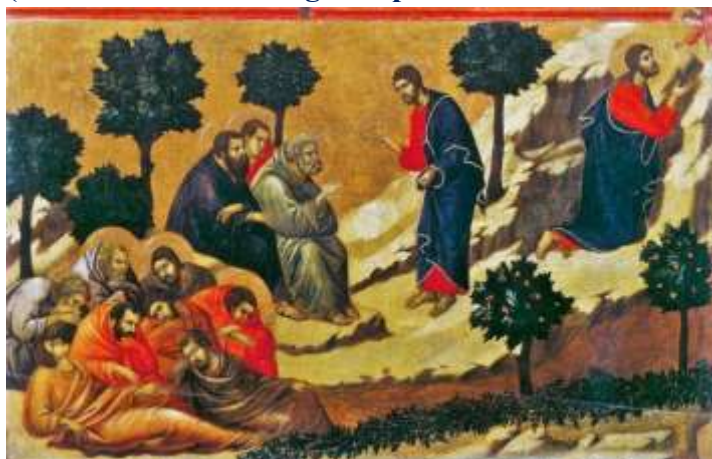
Nell'orto degli ulivi (Duccio) Matteo 26, 36-46