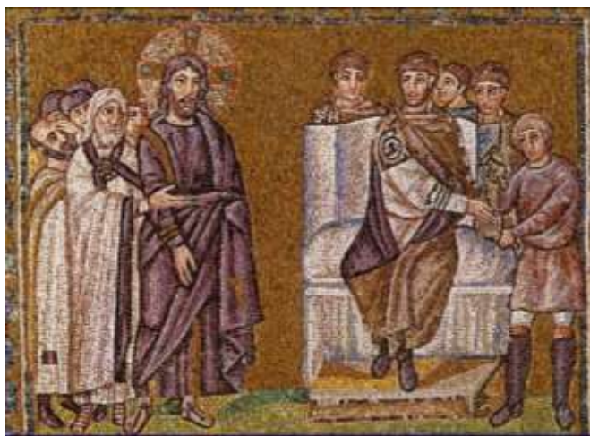
Gesù davanti a Pilato (Mosaico) Matteo 27, 11-24

Ti piace questo mosaico? Cosa ti piace di più? Perché?