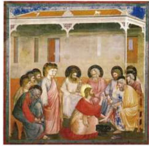
Lavanda dei piedi (Giotto) Giovanni 13, 1-15