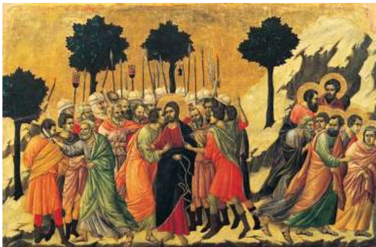
L'arresto di Gesù nell'orto degli ulivi (Duccio) Matteo 26, 47-50