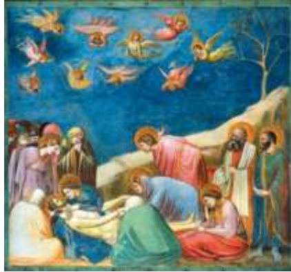
La Risurrezione di Cristo (Piero della Francesca)