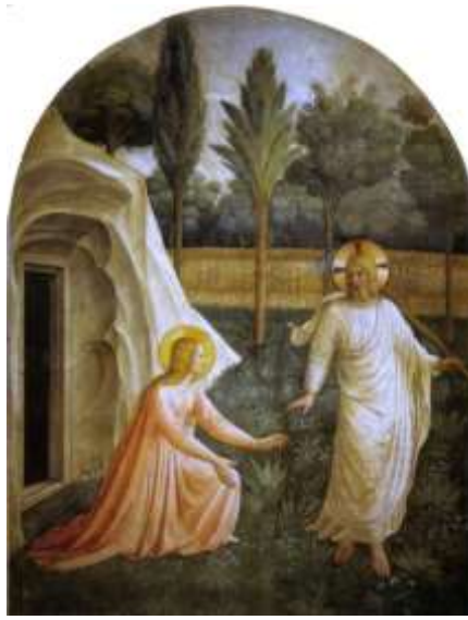
Noli me tangere, Beato Angelico Giovanni 20,11-18

Guarda bene e osserva il dipinto poi liberamente e con le tue parole racconta ad alta voce quello che vedi e quello che secondo te sta succedendo in questa scena... leggendo il Vangelo scopriremo insieme ciò che è accaduto a Gesù più di duemila anni fa.