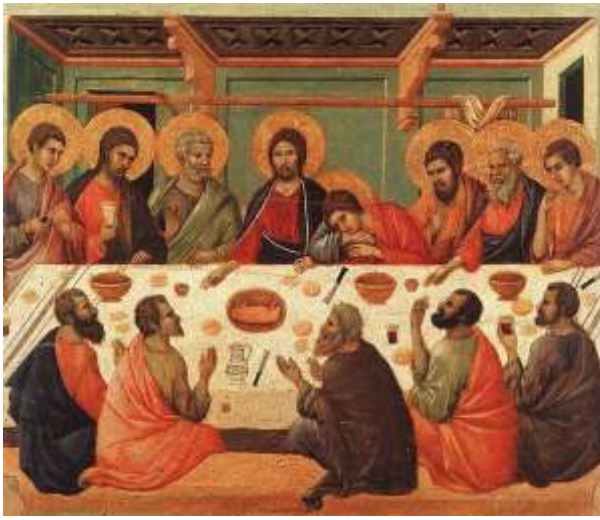
L'ultima cena (Duccio) Giovanni 13,1-15