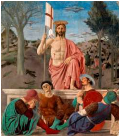
La Risurrezione di Cristo (Piero della Francesca) Matteo 28, 1-8

Guarda bene e osserva questo dipinto e poi liberamente e con le tue parole racconta ad alta voce quello che vedi e quello che secondo te sta succedendo ... leggendo il Vangelo scopriremo insieme ciò che è accaduto a Gesù più di duemila anni fa.