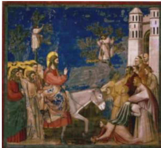
L'ingresso di Gesù a Gerusalemme (Giotto) Matteo 21, 1-11

Ti piace questo dipinto? Cosa ti piace di più? Perché?